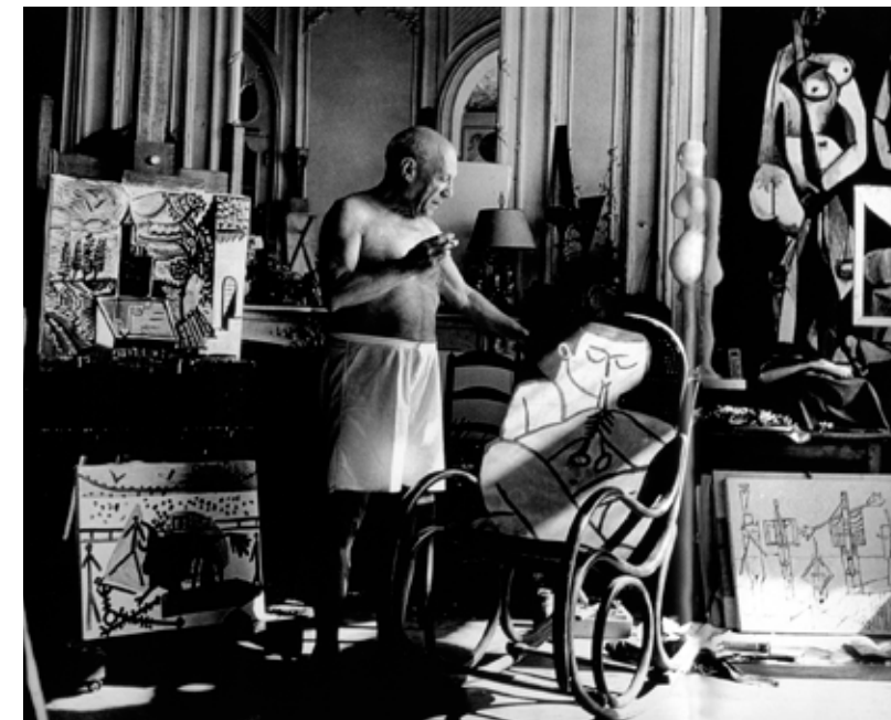
Пабло Пикассо на своей вилле «Калифорния» в Каннах, 1957 г.

от Eugenia Minerva, любопытный парафраз на тему старого-доброго кресла-качалки – Wave, дизайн – Michal Riabic... Но мы вновь обратим свой взор на знаменитый стул №14. Число его деталей сведено к минимуму – их всего шесть. Конструкция доведена до совершенства. Это его бросали с Эйфелевой башни, и это он участвовал в веселых кинодраках Чарли Чаплина. Классика, идеально вписывающаяся в современный интерьер.